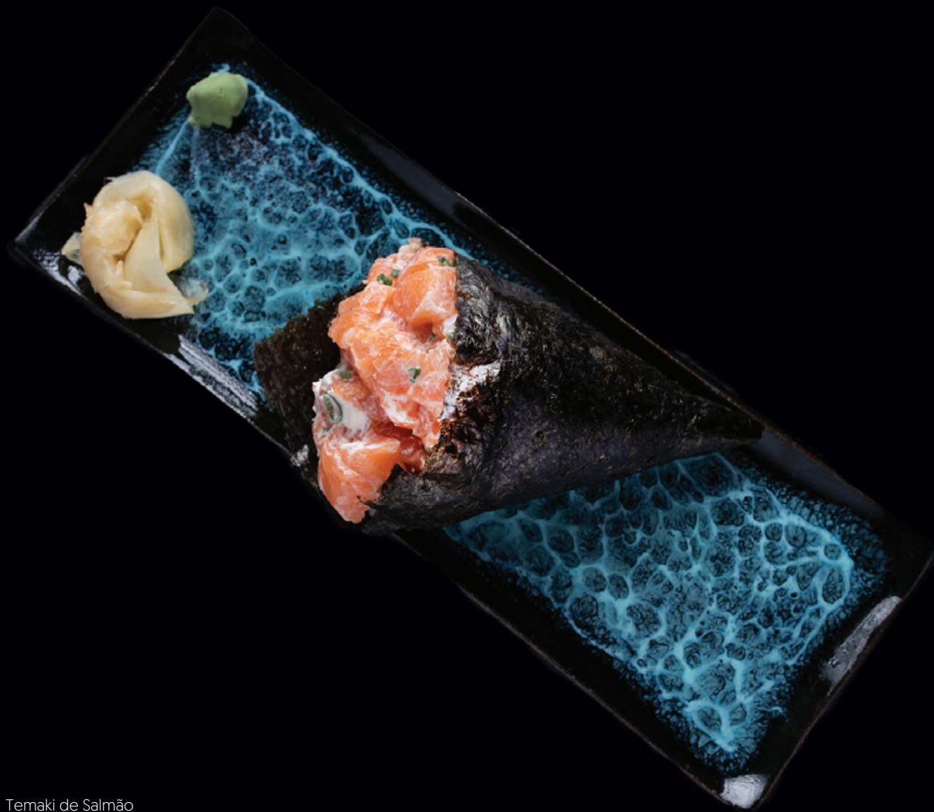
Temaki de Salmão

*Sem arroz, é acrescentado 5 reais ao valor do Temaki.