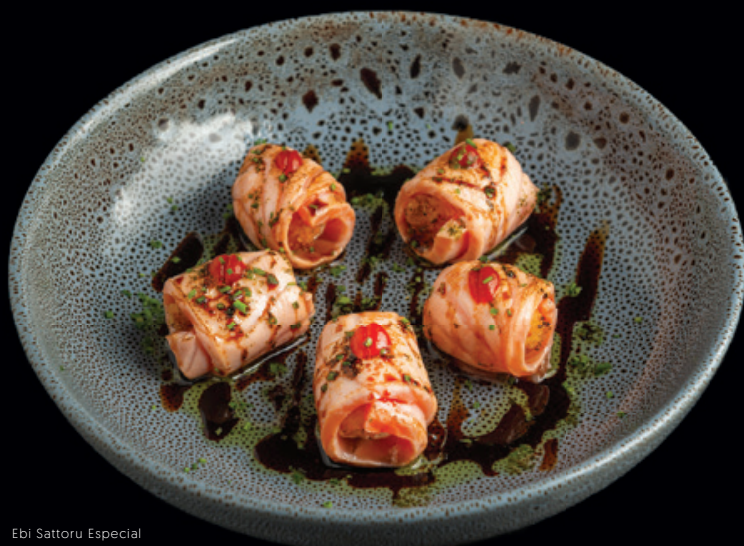
Ebi Sattoru Especial