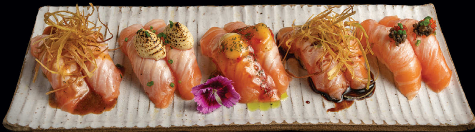
Especial Niguirí 10 Peças