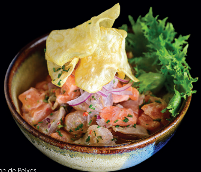
Ceviche de Peixes