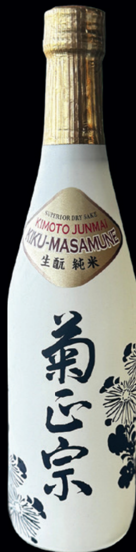
Saquê Junmai Kimoto