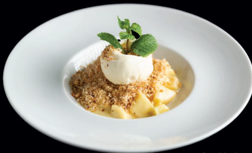
Crumble de Maçã