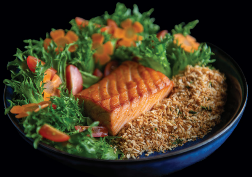
Shake Summer Fresh