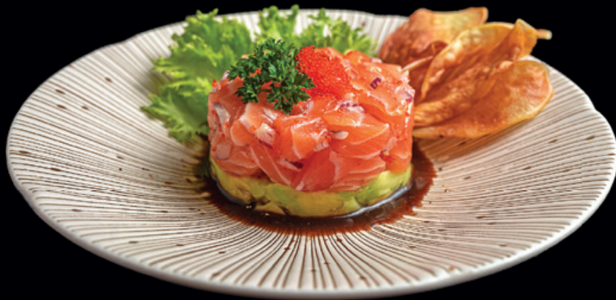
Tartar de Salmão